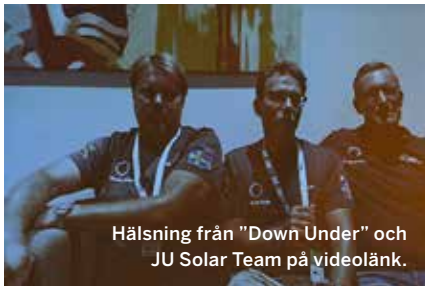
Hälsning från "Down Under" och JU Solar Team på videolänk.