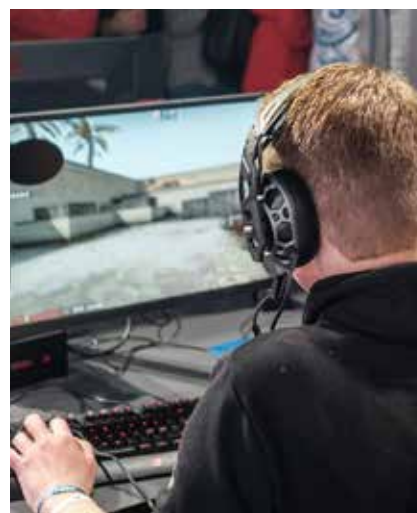
Till Jönköping och DreamHack strömmar tusentals e-sportare från hela världen två gånger per år.