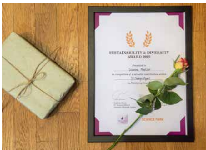
JU Sustainability & Diversity Award delades ut för första gången, i totalt sju olika kategorier.