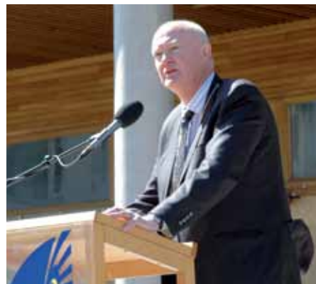
Rektor hälsar våren välkommen.