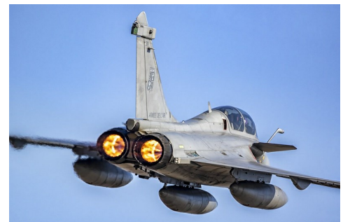
Stridsplan med efterbrännkammare.